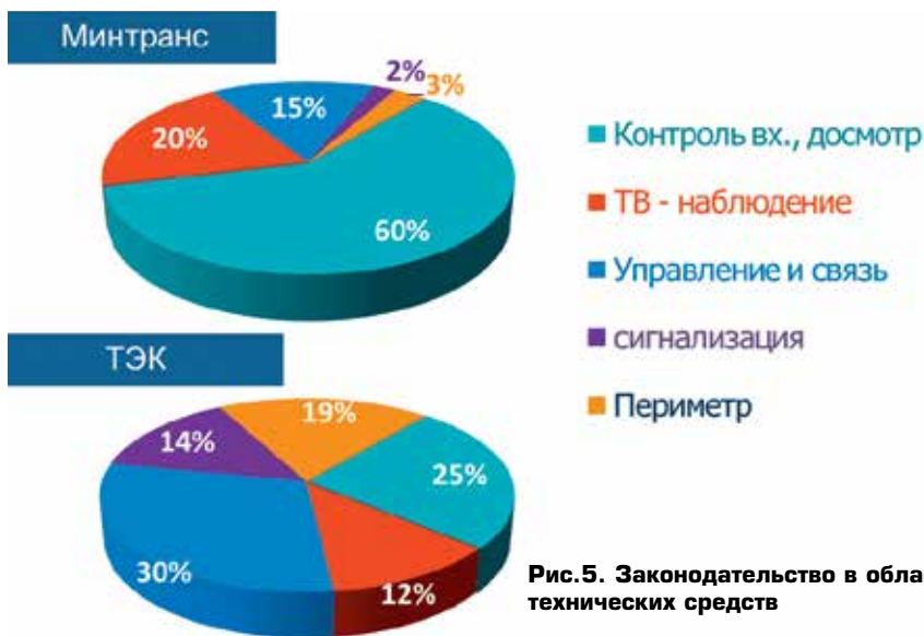
Рис.5. Законодательство в области технических средств

десятки, если не сотни. Не вызывает, на мой взгляд, сомнений, что надежно защищенный периметр объективно важнее нескольких дополнительных интроскопов и удобств, связанных с их использованием.